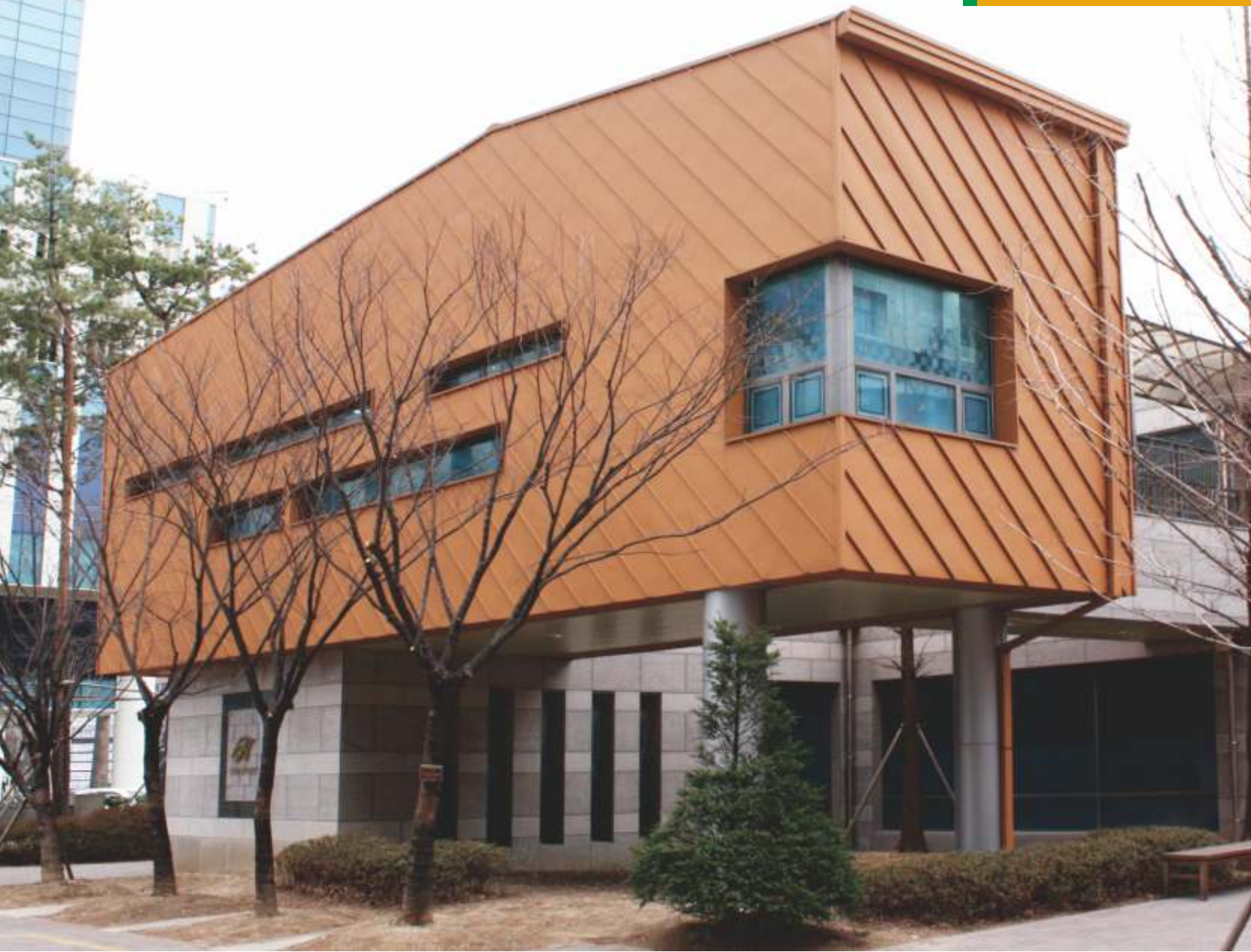
서울시 서울숲 힐스테이트