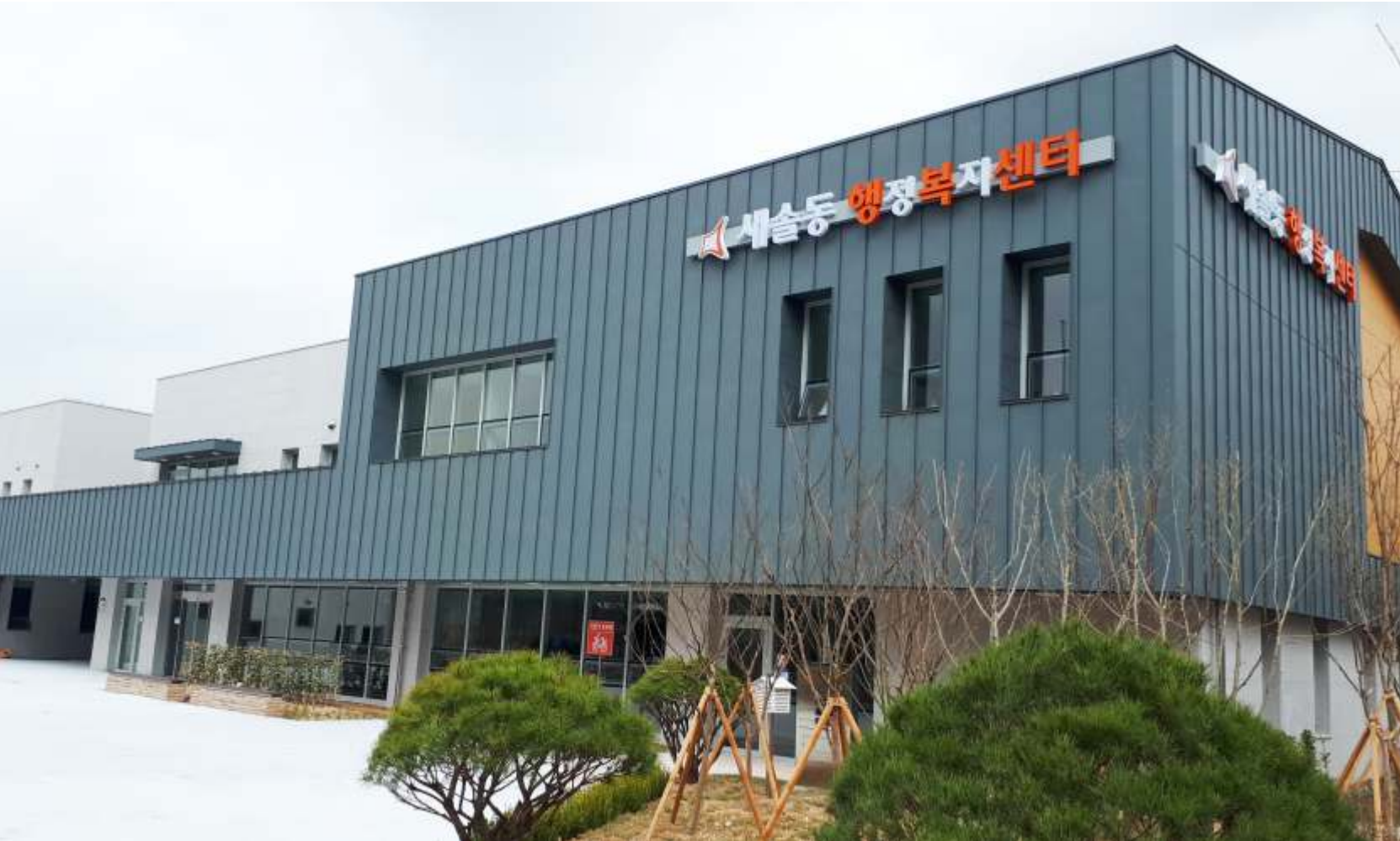
경기도 화성시 새솔동 행복복지센터