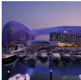
Yas Island, Abudhabi