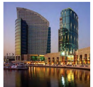
Dubai Festival City, Dubai