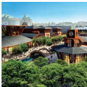
Resort World Sentosa, Singapore