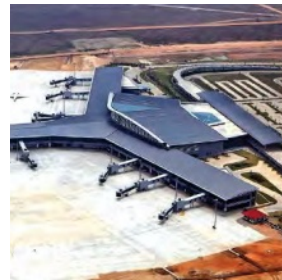
Naypyidaw Airport, Myanmar