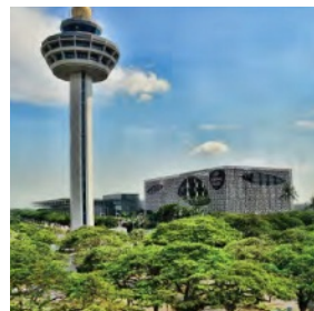
Changi Airport, Singapore