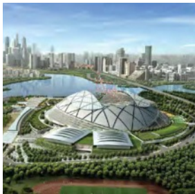
Singapore Sport Hub