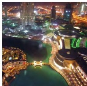
Dubai Mall, Dubai