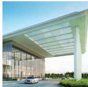
Ruby hall, Myanmar