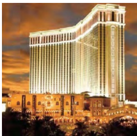
The Venetian, Macao