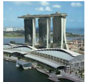
Marina Bay Sand, Singapore