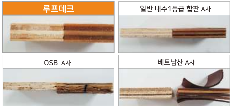
수분 흡수전 후 시편비교 자료 <100°C 2시간 침지>

시험방법 : 국립산림과학원 고시 제 2017-9호에 의거하여 시험 시편을 제작하여 시행 시험측정기관 : 국제 공인시험인증기관