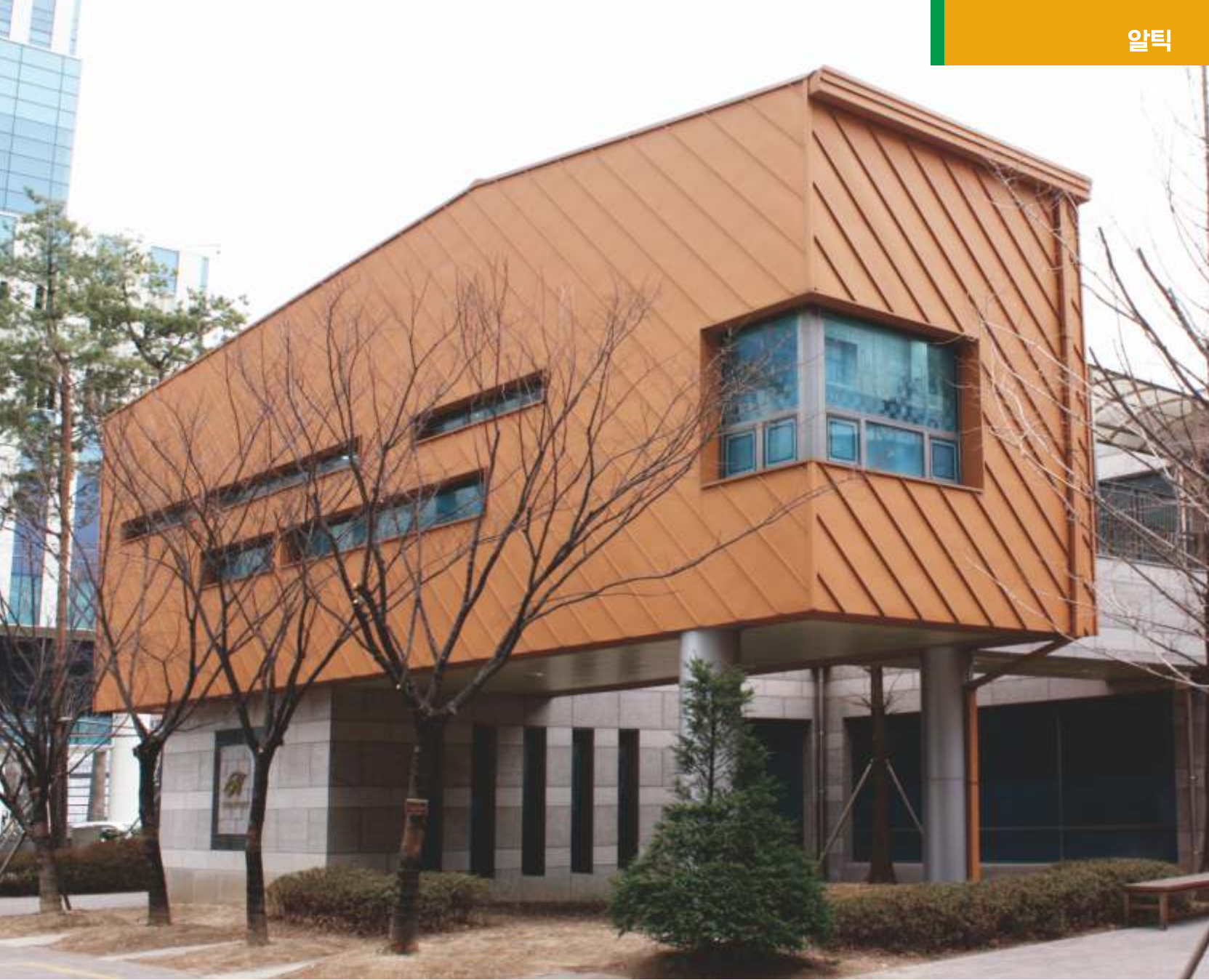
서울시 서울숲 힐스테이트