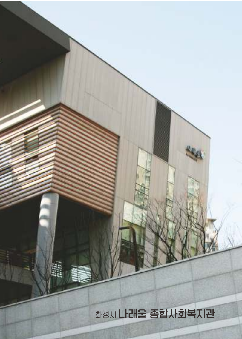
화성시 나래울 종합사회복지관