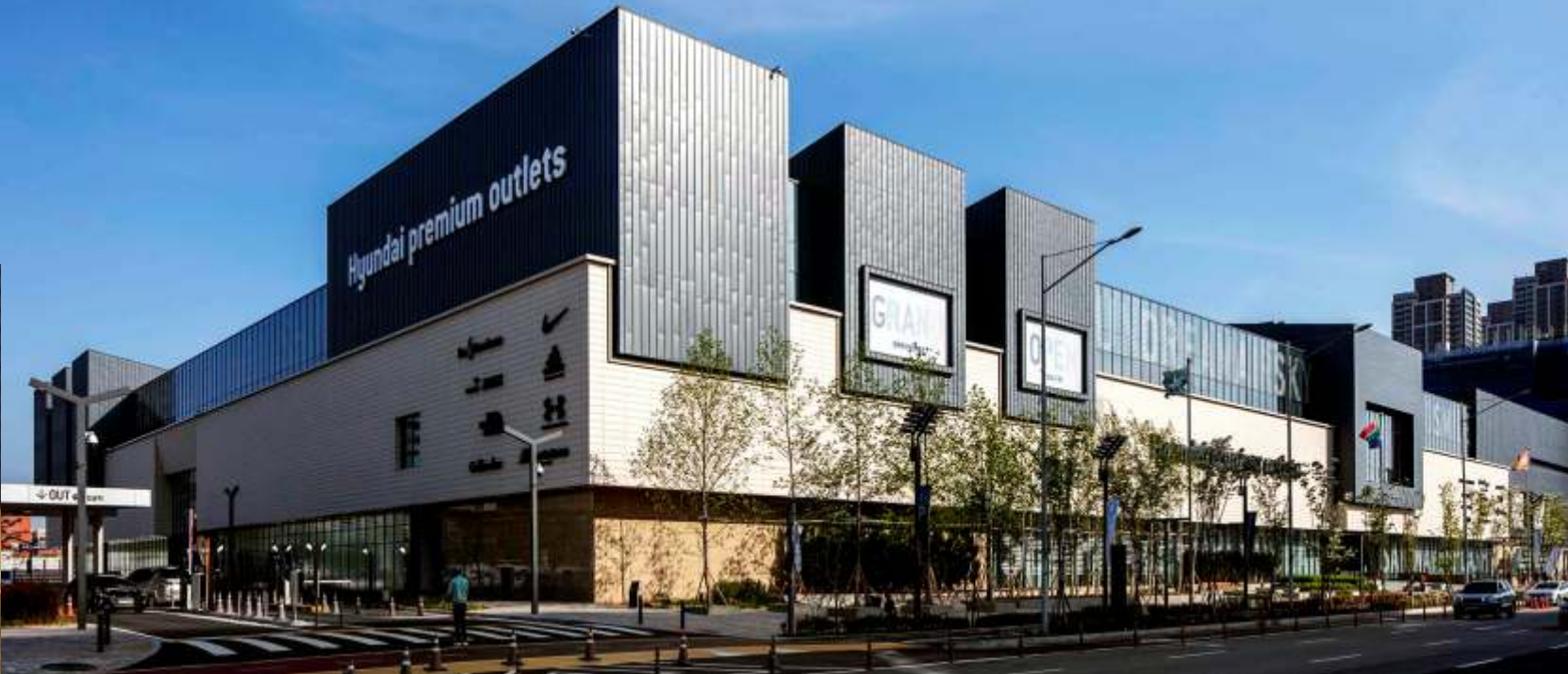
송도 현대프리미엄아울렛 | 이엘징크 블루/브라운