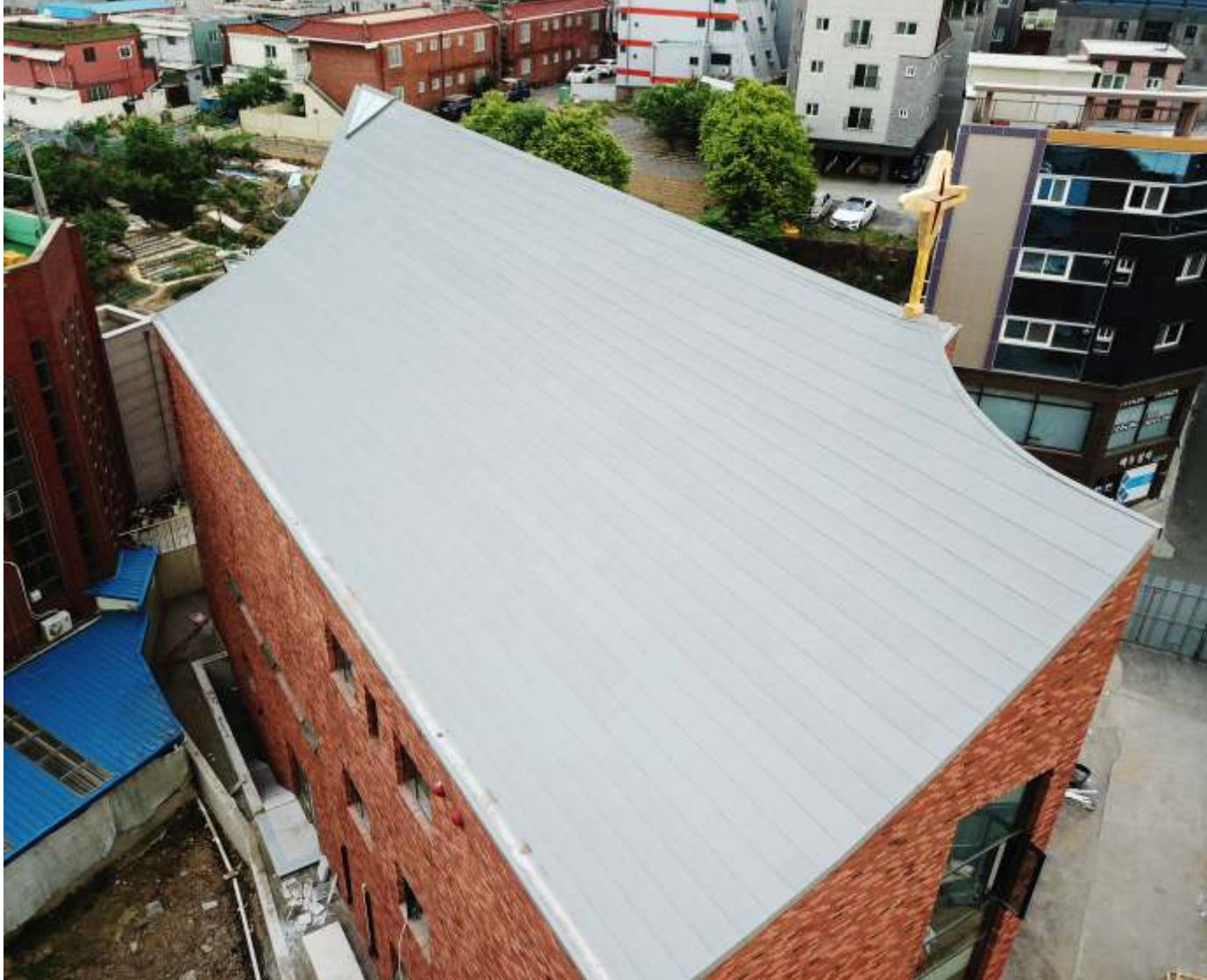
대구 경산 압량성당 | 이엘징크 슬레이트