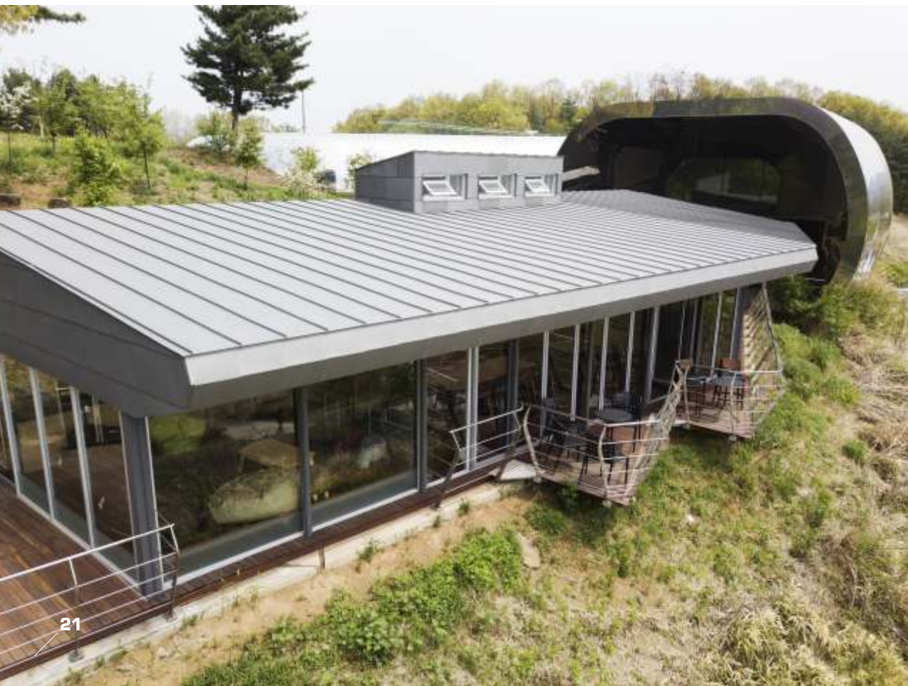
전곡선사박물관 카페테리아 | 이엘징크 슬레이트