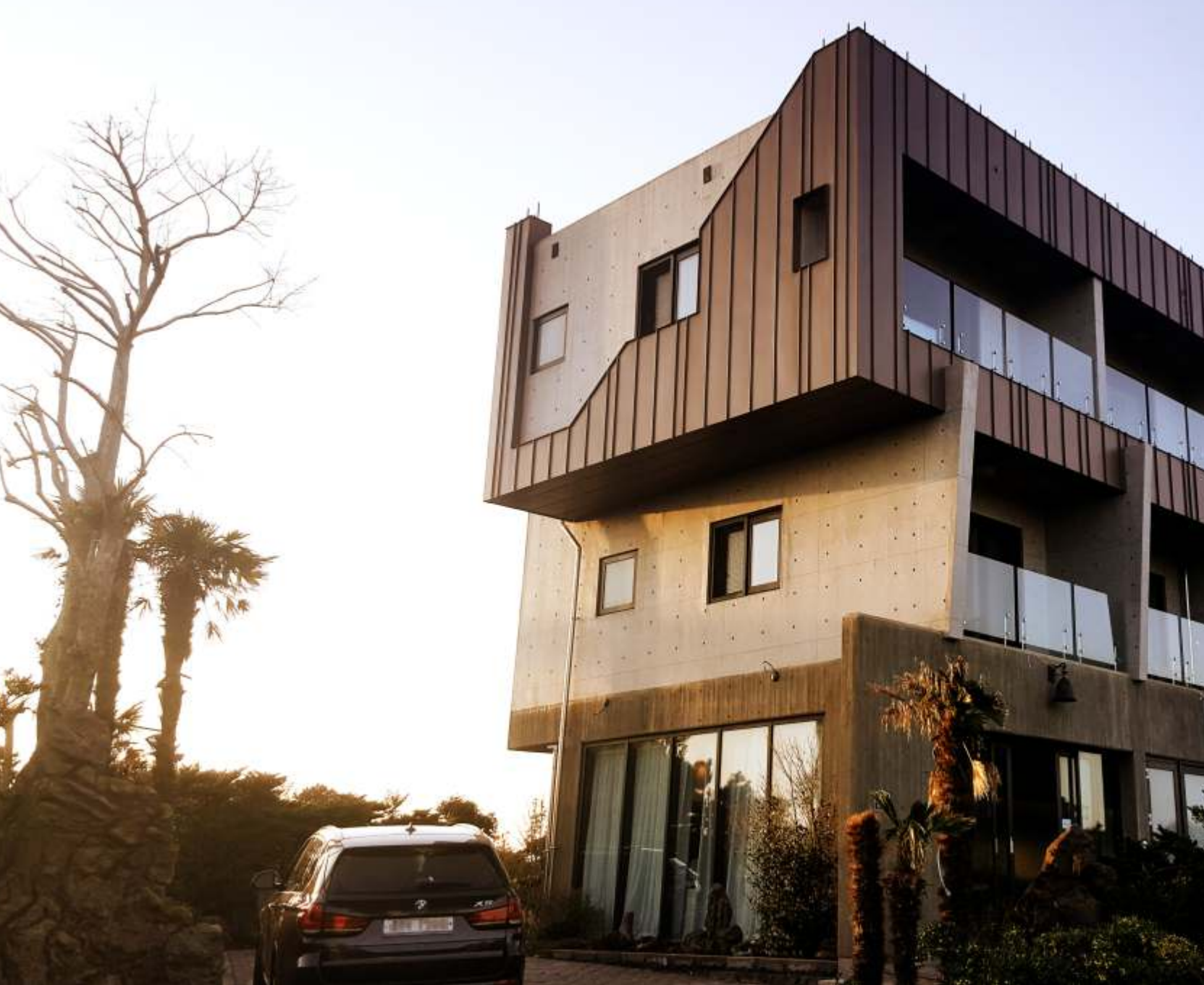
제주특별자치도 서귀포시 | 이엘징크 레드