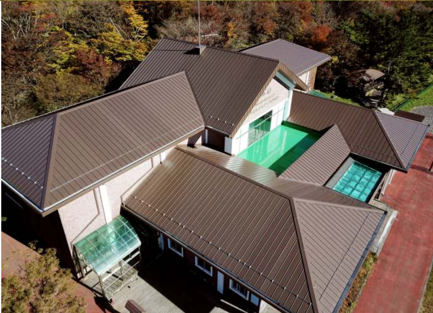
제주특별자치도 어리목탐방안내소 | 이엘징크 브라운