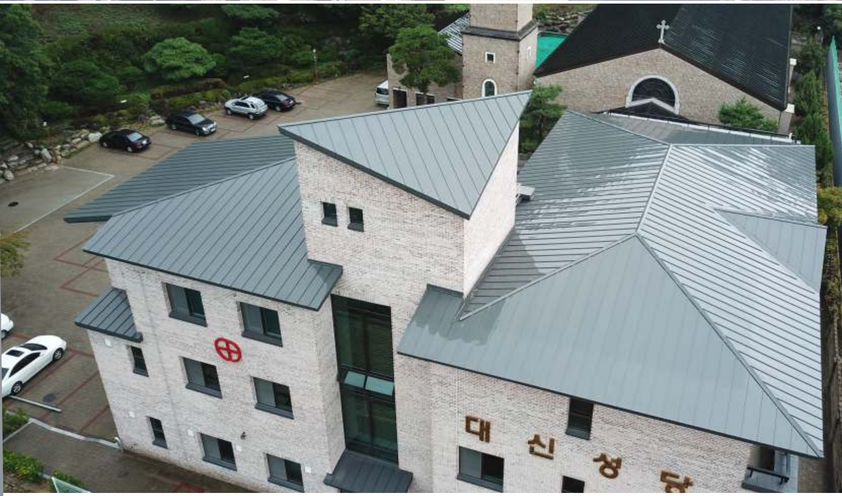
경북 김천시 대신성당