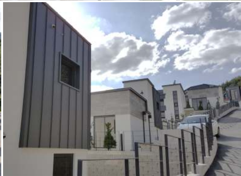
경기도 양평군 엘모로